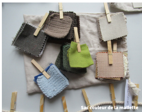
Sac couleur de la mallette