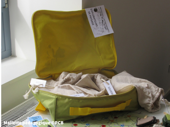
Mallette pédagogique ©PCB