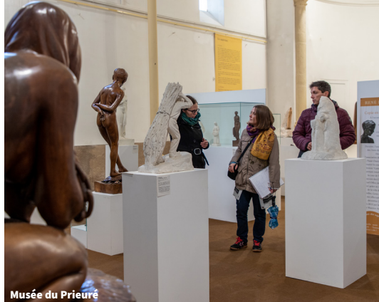
Musée du Prieuré

D'autres sites patrimoniaux se trouvent sur le Pays Charolais-Brionnais. Ils vous proposent toute l'année des animations qui complètent l'offre du Pays d'art et d'histoire.