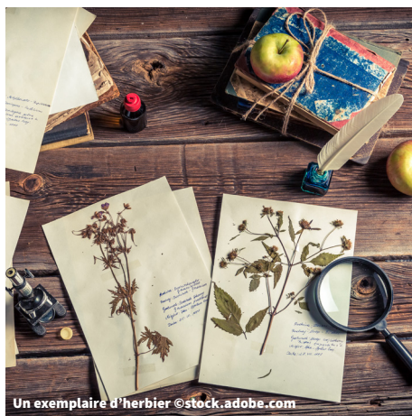
Un exemplaire d'herbier

Seules les premières pages de l'herbier sont complétées pour permettre aux élèves de continuer ce travail chez eux avec des plantes qu'ils collecteront pendant leurs balades.