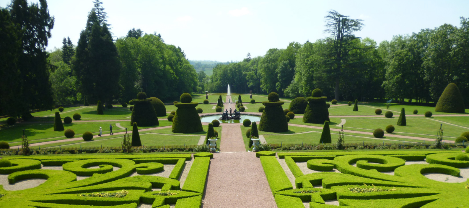
Château de Drée à Curbigny