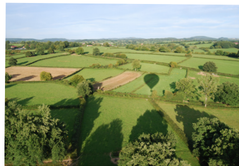
Paysage de bocage