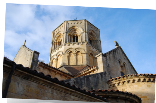
Collégiale Saint Hilaire