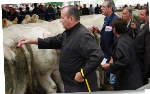
Marché aux bestiaux de Saint Christophe-en-Brionnais